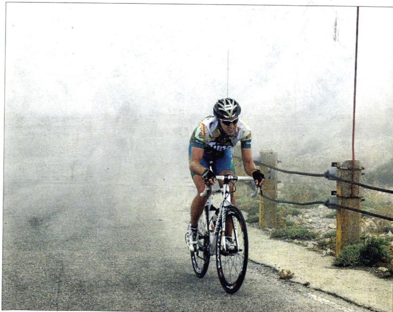
Regreso al techo. Después de dos años de paréntesis, la «Trencagarrons» volvió a pisar el techo de Mallorca, el frío y la niebla añadieron un plus de sacrificio a los corredores participantes pero también depararon imágenes tan bellas como las que aquí se muestran. • Fotos: NURIA RINCÓN. DEPORTES Páginas 56 y 57

Doscientos aficionados al ciclismo dan una lección de pundonor y casta al hollar la cima del Puig Major en otra durísima edición de la ya clásica del calendario, la «Trencagarrons»